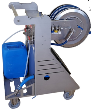
Alimentation 230v ou 380v EAU